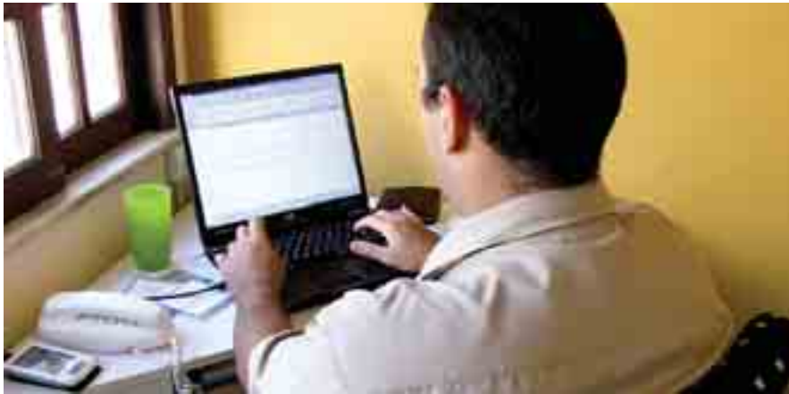
UN NUMERO IMPRECISABILE DI PERSONE DI ENTRAMBI I SESSI SI STIMOLA OGGI VIA INTERNET

dedicate, in uno scambio che diventa contatto, rapporto. Tutto virtuale, direte. Il fatto è che ci si eccita "come se" l'altro/a fosse lì davanti. La sessualità si adegua ai mezzi e la psiche, ancor prima, fa di necessità virtù, anzi morbosità se serve. E' questa la nuova sessualità? Che sia prediletta da molti giovani non vi è dubbio: già da tempo il linguaggio parlato è diventato codice cifrato negli sms. Come un tempo l'alfabeto muto per gli innamorati dietro i vetri. Dovremo capire che evoluzione