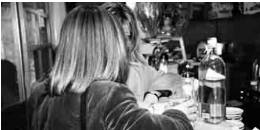
GLI ECCESSI DEI FIGLI SONO IMPUTABILI ALL'ATTEGGIAMENTO GIUSTIFICATIVO DEI GENITORI

ne accorgeranno i genitori di lei, dai funerali in poi. "Tanto fumare non è un dramma, lo fanno tutti..."