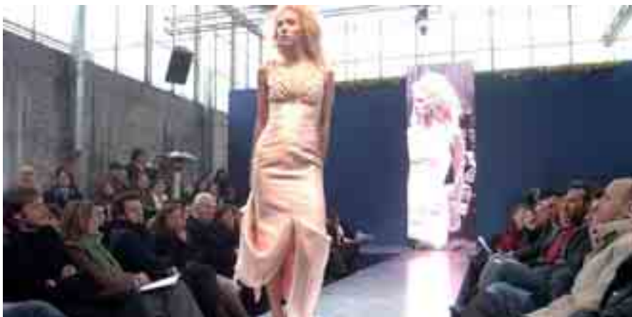
L'INDOSSATRICE È LA FIGURA VISTA COME PUNTO DI RIFERIMENTO PER SENTIRSI GRADEVOLI

nessuno di noi, oggi più che mai, è una monade autodeterminata e libera dagli influssi familiari o sociali. Tralasciarli è commettere un errore di approssimazione.