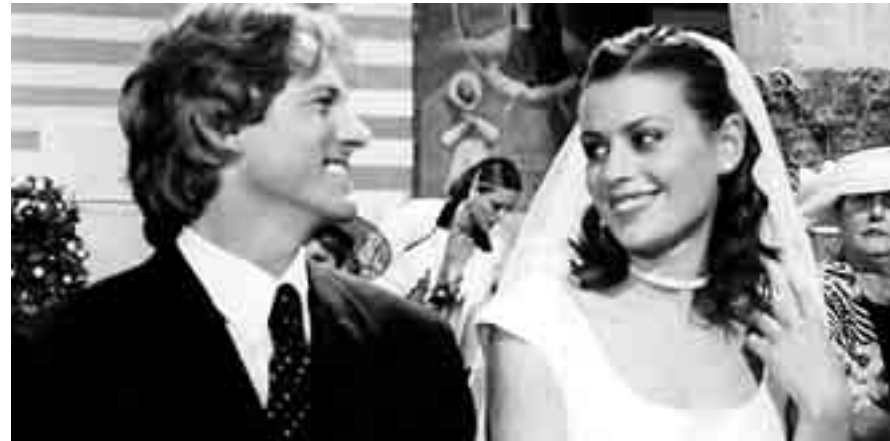
JULIO SCARPATI E CLAUDIA PANDOLFI NELLO SCENEGGIATO "UN MEDICO IN FAMIGLIA"

altro, gli scomparsi sono ancora più a tenuta stagna. Vita privata subordinata a quella di madre. Prendere o lasciare. I patti col nuovo compagno spesso sono chiari e perentori. I figli innanzi tutto.