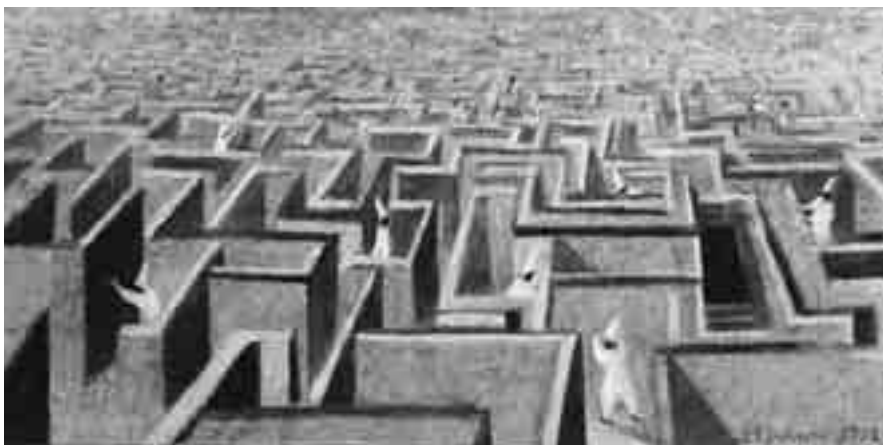
GIAN PAOLO DULBECCO: "LABIRINTO" (PARTICOLARE)

li agilmente in corsa. Certo, un sogno appunto misurabile. Che si traduce in presupposti concreti, ad esempio un marchio di supermercati per posizionarne di nuovi dovrà studiare le migliori collocazioni logistiche, servirsi del migliore personale sulla piazza ed addestrarlo nel miglior modo nel rapporto con la clientela.