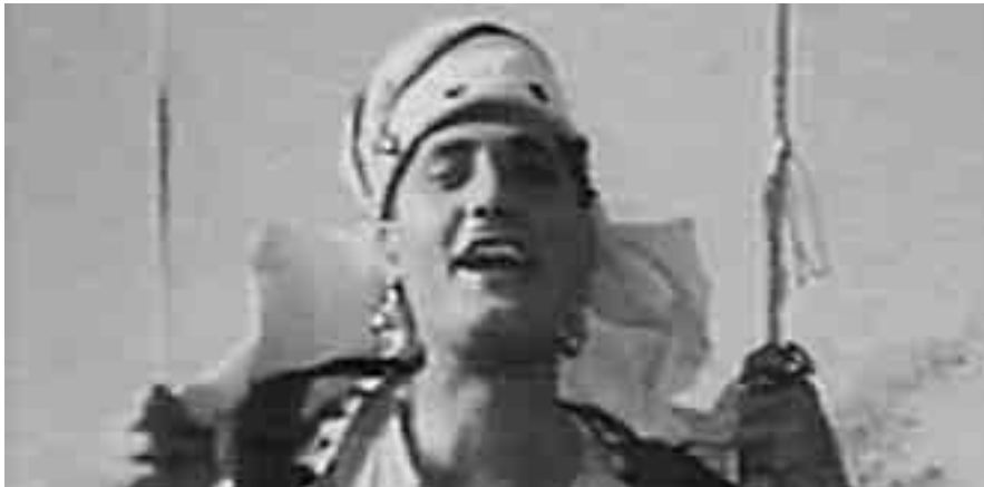
ALBERTO SORDI, INTERPRETE DEL FILM "LO SCICCO BIANCO", STATUS SYMBOL DEL SEDUTTORE

perché anormale. L'irresistibile non ammette resistenze, né tanto meno rifiuti. Se lo facesse crollerebbe il proprio mito, fondato sull'asunto di poter conquistare chiunque comunque, solo a patto di volerlo davvero.