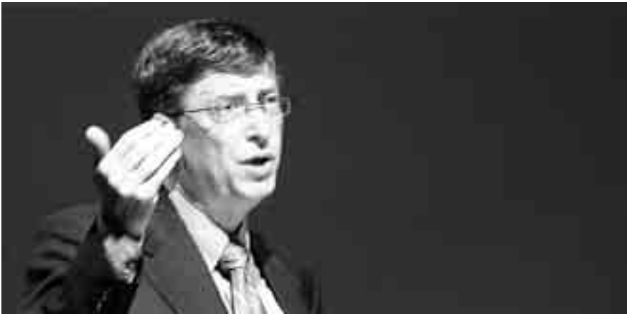
BILL GATES, IL TYCOON DI SEATTLE, HA IMPOSTATO LA SUA VITA SUGLI INVESTIMENTI FINANZIARI

vismo, proprio ad indicare l'esistenza dedicata ad un impegno lavorativo indefesso. Stakhanov, non a caso, in quella nazione e oltre i suoi confini, è stato un'icona per il suo modo di sfruttare al massimo il rendimento dei lavoratori.