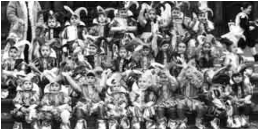
BAMBINI IN COSTUME DA GIULLARE. SARÀ QUESTA LA NUOVA GENERAZIONE DEL FUTURO?

poco e sulle quali si imposta l'esistenza.