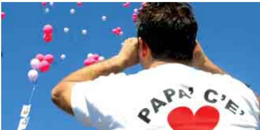
NESSUN GENITORE PUÒ MAI DIRE DI CONOSCERE I FIGLI. TENGONO SEMPRE SEGRETI NASCOSTI

ti e riflessivi. I genitori pensano di conoscere loro la verità, ma questa certezza può essere ribaltata a favore di un osservatore esterno, privo di stereotipi, distrazioni, pregiudizi. Chi vede la verità? E' un dubbio che chi è infetto da certi "virus mentali" non si pone neppure, continuando a sbagliare.